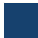
RAL 5005 Pantone 7462C