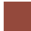
RAL 8004 Pantone 7593C

Kingspan ofrece una amplia variedad de colores personalizados, bajo pedido. Nuestro equipo de ventas lo asesorará para satisfacer los requerimientos específicos de diseño.