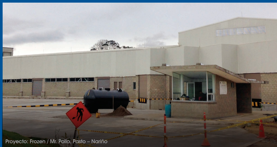
Proyecto: Frozen / Mr. Pollo, Pasto – Nariño