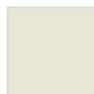
RAL 9002 Pantone Warm Grey 1C