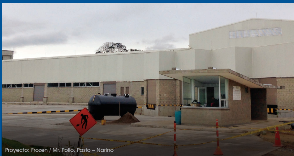
Proyecto: Frozen / Mr. Pollo, Pasto – Nariño