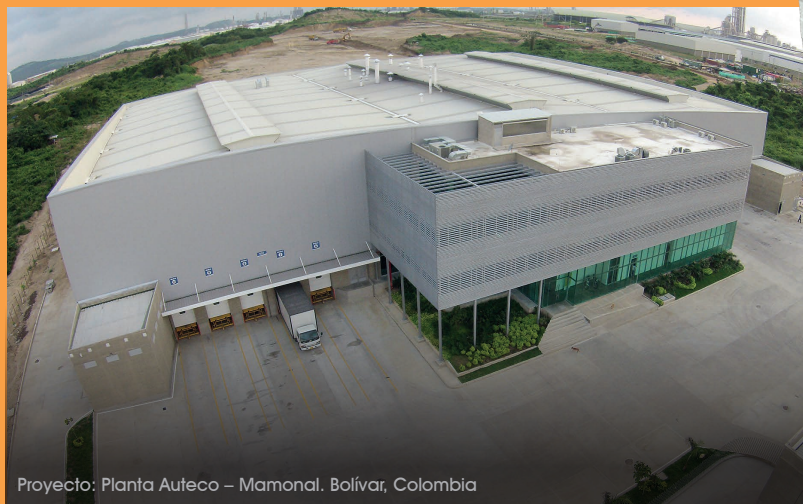
Proyecto: Planta Auteco – Mamonal, Bolívar, Colombia