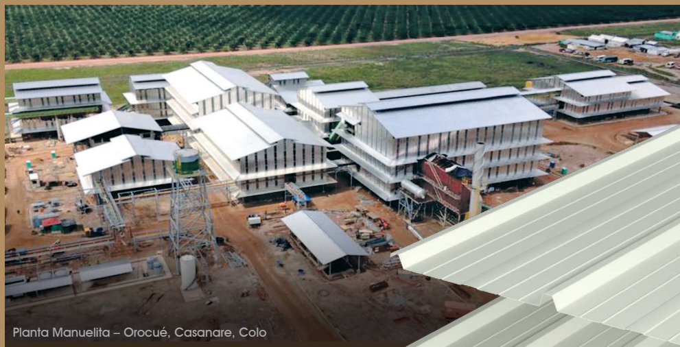
Planta Manuelita – Orocué, Casanare, Colo